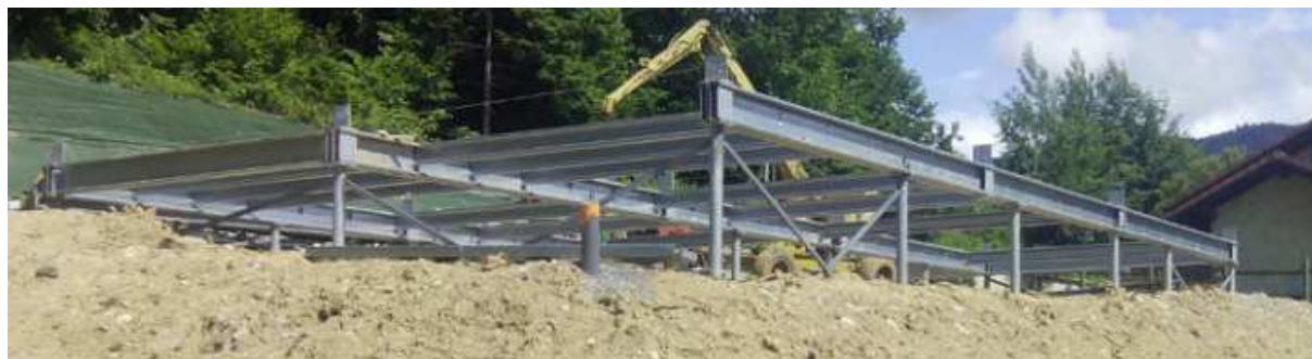
Exemple (Photo non contractuelle).

Socle autorisant la fixation directe sur pieux, soit par boulonnage, soit par soudure.